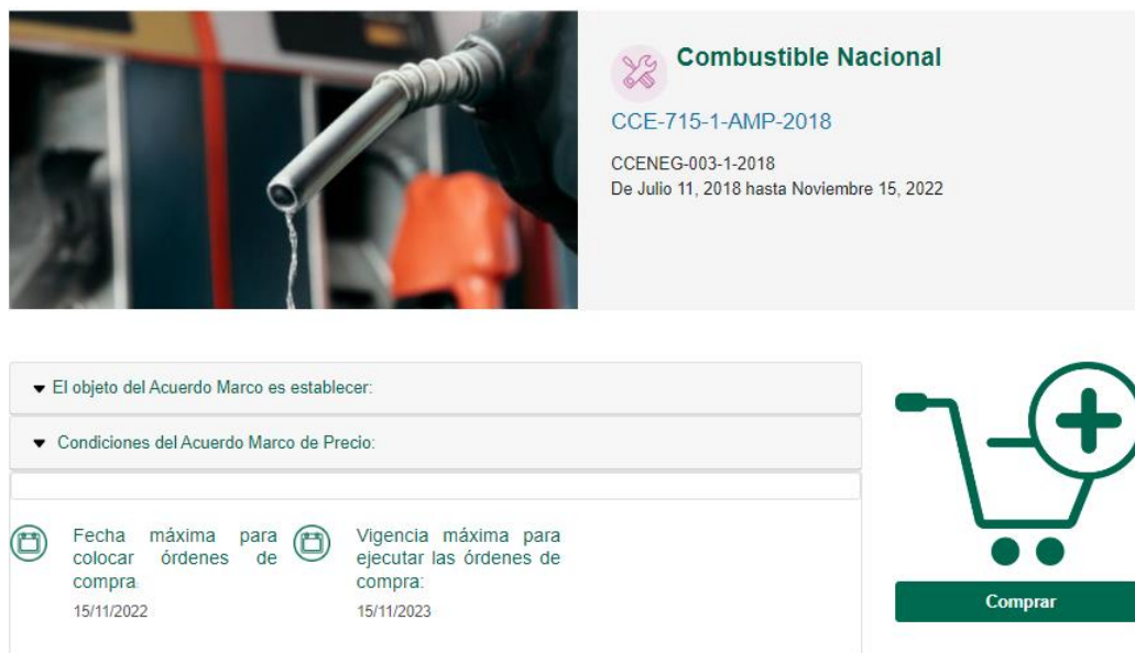
Ilustración 3 minisitio

5.2.3 Se abrirá una ventana que lo redireccionará al minisitio en donde usted verá el Acuerdo Marco de Combustible Nacional, sus datos y documentos.