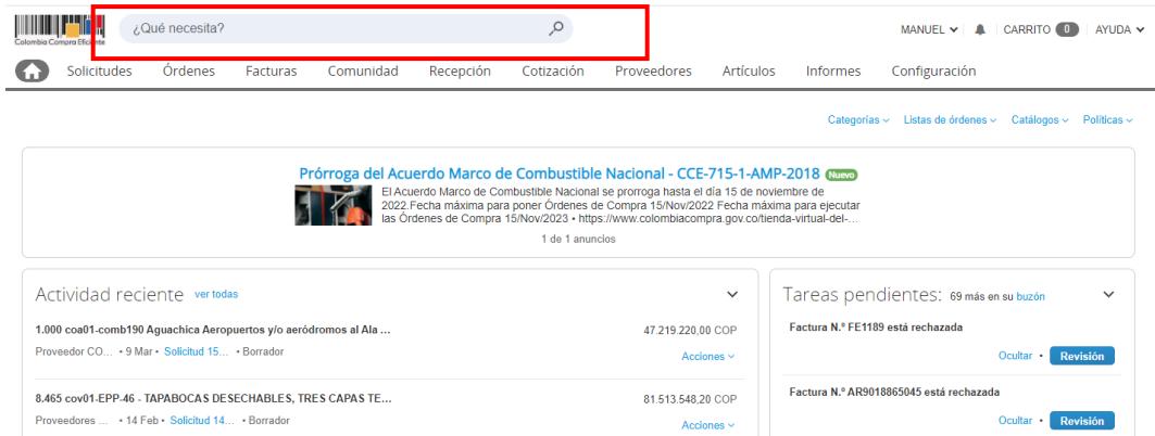
Ilustración 6 buscador

5.3.2 En esta sección la Entidad Compradora encontrará el Combustible para cada una de las Categorías del Acuerdo Marco [A, B, C y D]. El resultado de la búsqueda muestra el catálogo de los Proveedores que ofrecen suministro de Combustible en las diferentes Categorías.