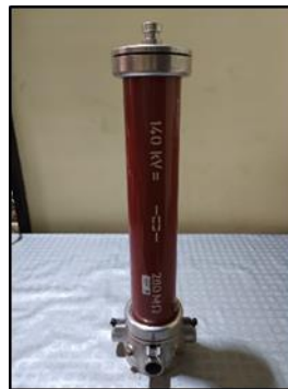
Divisor Resistivo Puro

Con el fin de dar más claridad a la empresa ICL DIDACTICA SAS, nos permitimos adjuntar una imagen ilustrativa del "Divisor Resistivo Puro" mencionado anteriormente.