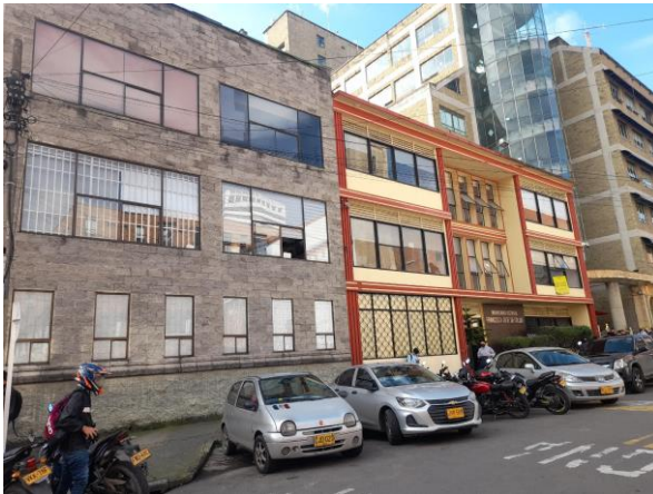
EDIFICIO ALEJANDRO SUAREZ Y LA RED A DEMOLER